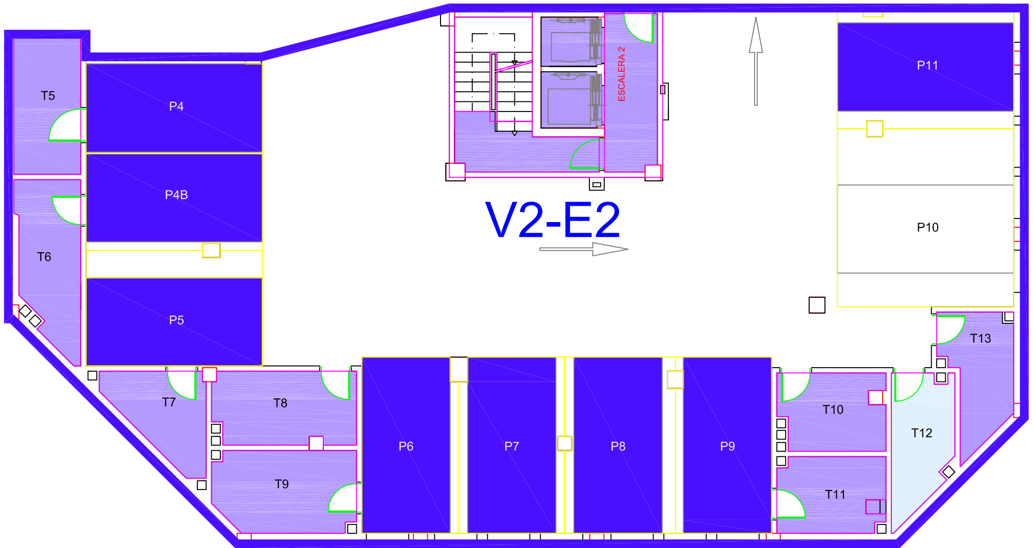
SÓTANO NIVEL 1 V2 - E2 COOPERATIVA PARQUE PRÍNCIPE FASE I