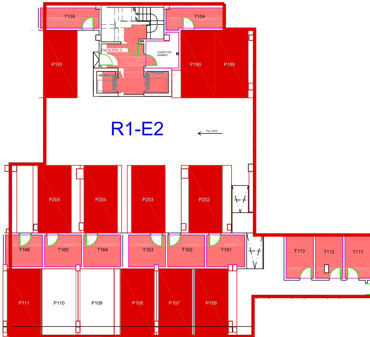
SÓTANO NIVEL 2 R1 - E2 COOPERATIVA PARQUE PRÍNCIPE FASE I